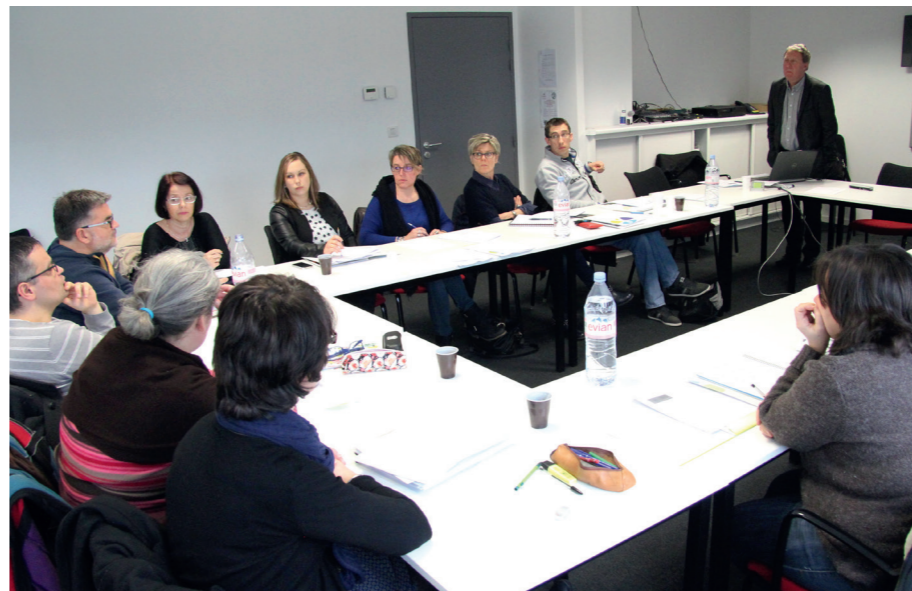
Les formations associatives de l'Adapei Côtes d'Armor (ici les nouveaux modes d'accompagnement) sont ouvertes aux salariés des Nouelles.

L'un des axes de réflexion et de travail figurant dans la convention de partenariat porte sur « l'élaboration d'une stratégie opérationnelle sur le champ du travail protégé ou d'insertion