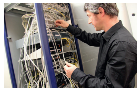
Les techniciens informatiques de l'Adapei Côtes d'Armor interviennent dans les services des Nouelles, ici au SAVS de la rue des Gallois à Tréguieux.